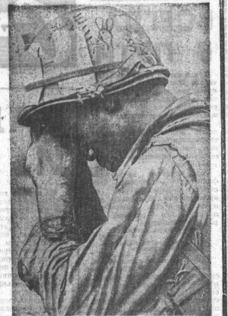
ЮЖНЫЙ ВЬЕТНАМ. Этому уставшему от войны американскому солдату есть о чем помянуть. Бойцы Народных вооруженных сил освобождения продолжают наносить удар за ударом по войскам агрессора.

ВОЕННЫЕ ДЕЙСТВИЯ В НИГЕРИИ ЛАГОС. По сообщениям из районов боевых действий в Нигерии, 1-я и 2-я дивизии федеральных вооруженных сил после ожесточенных шестидневных боев соединились в районе населенного пункта Огиди, окружив и отрезав от линии снабжения атакающую группировку войск сепаратистского режима Оджукву. Сообщается, что федеральные войска захватили при этом более 800 солдат противника и значительное количество трофейного оружия. Федеральные войска ведут бой с целью ликвидации последних очагов сопротивления окруженной группировки.