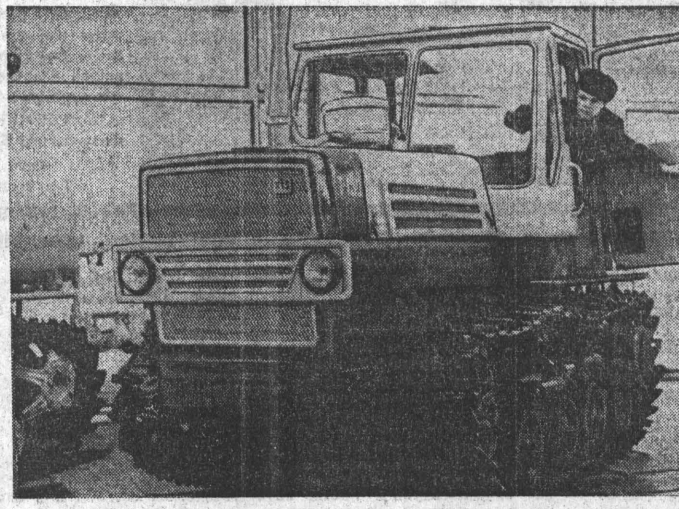
НА СНИМКЕ: трактор Т-150.

Несколько дней назад в детскую больницу № 1 в тяжелом состоянии доставили мальчика, которому не исполнилось и двух лет... Олега Дежидова.