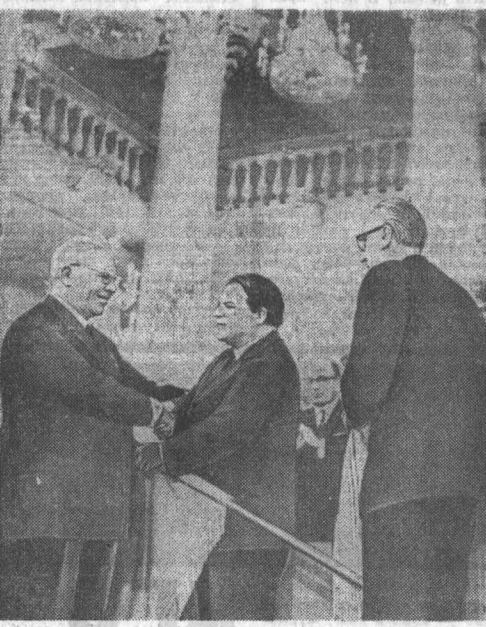
Вручение ордена Ленина Союзу композиторов СССР.

Значение советской музыки, подчеркивает Н. В. Подгорный,