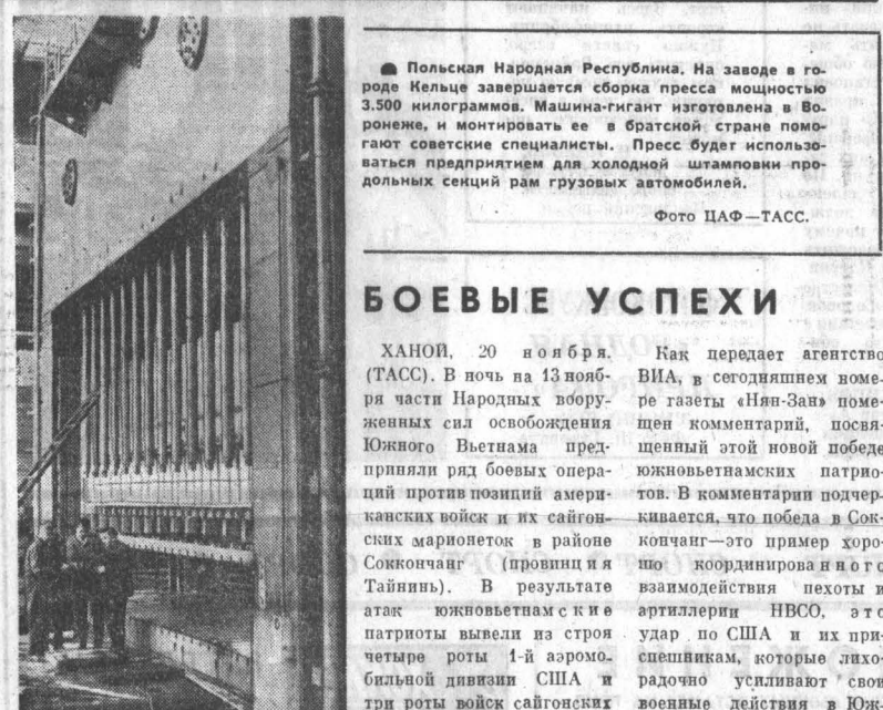
Польская Народная Республика. На заводе в городе Кельце завершается сборка прессы мощностью 3.500 килограммов. Машина-гигант изготовлена в Варшаве, и монтируется ее в братской стране помогают советские специалисты. Пресс будет использоваться для производства продукции рам грузовых автомобилей.

Решения ноябрьского пленума ЦК КПЧ — высшего органа партии — даю всем коммунистам и всему обществу ясную и конкретную партию того, что последняя всадная политика партии, освобожденная от негативных явлений последяварского разветления, будет и впредь развиваться и постепенно реализовываться. В связи с этим А. Дубчек подчеркнул обязательность документов ноябрьского пленума ЦК КПЧ для всех членов, организаций и органов партии. Он констатиро-