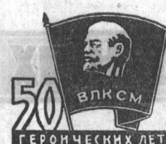
50 ВЛКСМ ГЕРОИЧЕСКИХ ЛЕТ