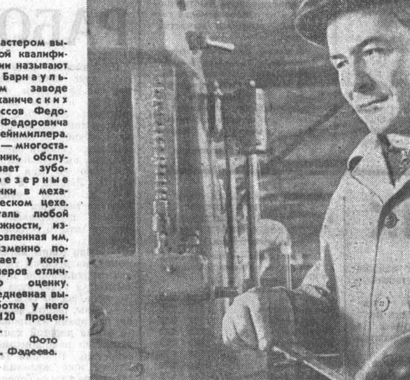
Фото А. Фадеева.