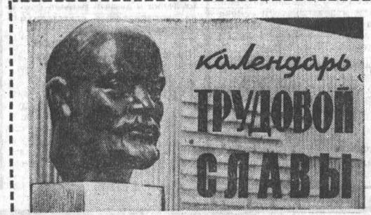
В Барнауле состоялось вечернее заседание Президиума Краевого Центра.