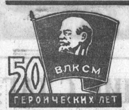
50 ВЛКСМ ГЕРОИЧЕСКИХ ЛЕТ