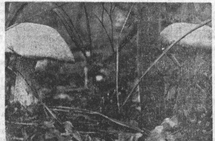
ДАРЫ ЛЕСА.