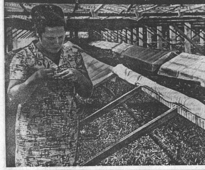
Недалеко от Бийска, по берегам Катуня, почти на сотни километров протянулись облепиховые заросли. Охраной и выращиванием их занимается Бийский учебно-опытный лесхоз. В этом году лесхоз заготовит 30 тонн плодов облепихи — ценного лекарственного сырья. Ежегодно лесоводы производят посадку облепихи на двукрат и более гектарах. Но очень часто посаженые преобладают лесоводы высевают лучшие экземпляры кустов. Отличить же немолодые кусты от молодого можно только в период плодоношения. Чтобы внести определенную плановость, бийские лесоводы начали выращивать послоновидный материал из черенков. От высокопродуктивных сортов выделяются черенки, которые высаживаются в парничках. Здесь создается оптимальные условия для отращивания у них корневой системы. Н. СНИЖКЕ, высеивающие в парничках растения осматривают лесоводы В. И. Володкина.