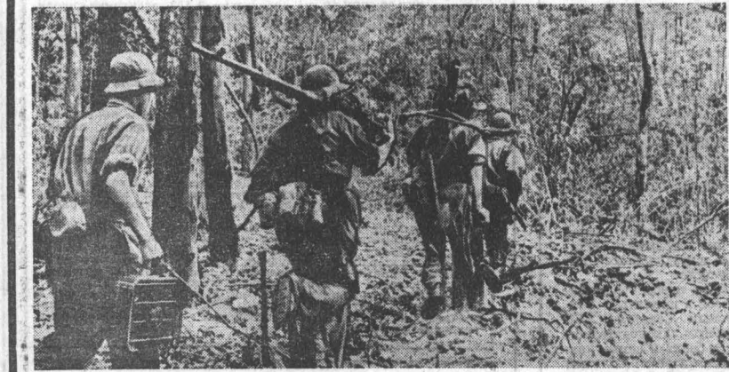
● ЮЖНЫЙ ВЬЕТНАМ. Бойцы Народных вооруженных сил освобождения Южного Вьетнама в походе.