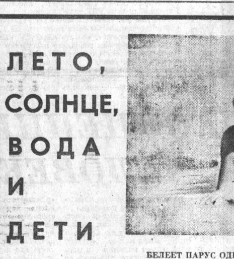
БЕЛЕЕТ ПАРУС ОДНОКОПИ.

ждать разработанную композицию или готовый сюжетный танец. Ведь у нас есть самый сильный материал, которым мы располагаем в полной мере, — это сложившиеся коллективы, давно выросшие до больших полотен, достойные нашей молодежи, ее героического прошлого, ее светлого настоящего и прекрасного будущего.