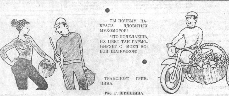
ТРАНСПОРТ ГРИБНИКА. Рис. Г. ШИШКИНА.

Между тем тут есть о чем поговорить. И с кого спросить: с кондуктора, подозревающего в каждом пассажире международного (ОПС) «зайца»; с шофера-таксиста, недоброго человека, что пассажир едет не в Чер-