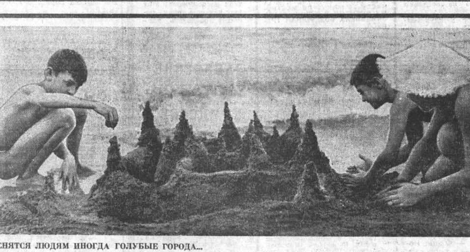
СВЯТСЯ ЛЮДИМ ШНОГДА ГОЛУБЫЕ ГОРОДА...

«Многие люди придумали для выражения своей радости и яркие живописные полотна, и эвонские стихи, и веселые песни. Но вершина радости — танец. Нельзя остаться равнодушным к этому удивительному проявлению светлых человеческих чувств, к этой удаленной, но необыкновенной, почти гипнотической силе, охватывающей людей, заставляющей забыть себя...»