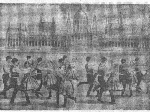
110 юношей и девушек готовятся к поездке в Софию. Такова численность культурной группы венгерской фестивальной делегации. Национальное искусство будут представлять солисты и художественные коллективы. Последние репетиции проводит Центральный ансамбль Венгерского Коммунистического союза молодежи. Созданный в 1950 году, он уже выступал с гастролями в 24 странах мира и получил признание на предыдущих фестивалях. НА СНИМКЕ: артисты ансамбля исполняют веселый народный танец на фоне старинного здания венгерского парламента.