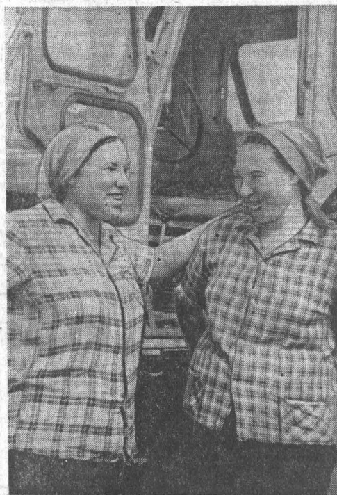
Павловский район.

удорожание ее на 0,75 копейки. Полугодовая программа сведена с трудом, что называется, в обрез. Между тем, по обязательствам коллектив должен закончить годовую план к 26 декабря. Накапливаются причины для штурмовщины в оставшихся двух кварталах. Не только в этом — по многим пунктам обязательств. Названная нами цифра сверхплановой продукции не составила и трети от годовой.