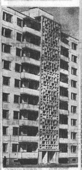
Проблемы качества строительства

В Барнауле довелось слышать, что крупные панели разрушают красоту города. Может быть, если к монтажу домов подходить бездумно. У нас, например, более семейств процентов строительных домов — крупнопанельно. А взгляните на снимок — чем плох этот квартал?