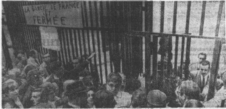
В Колонии Дома Союзос в Москве состоялось торжественное мероприятие, посвященное культурному обмену с братскими народами.