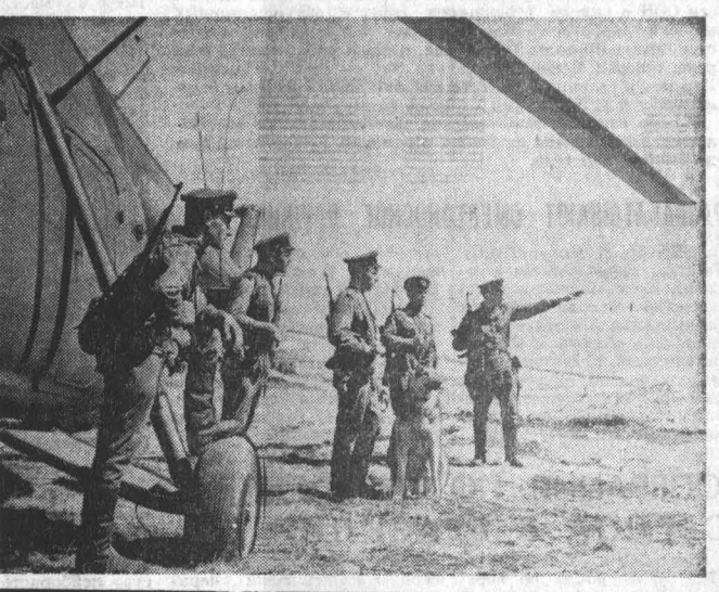
Редактор А. ПРОЗОРОВ.