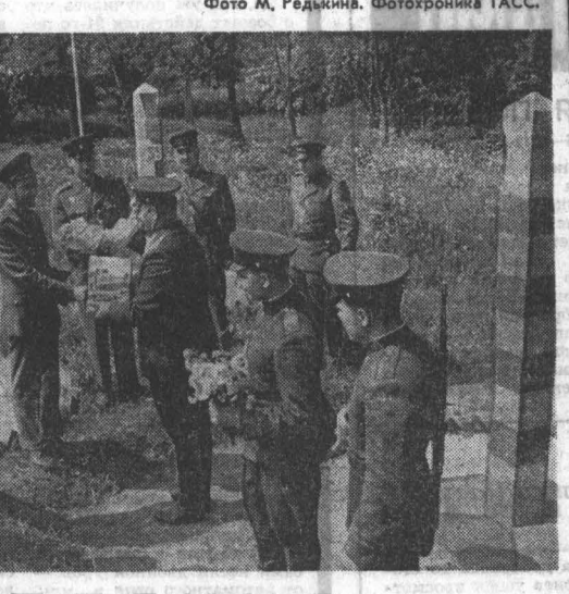
НА СНИМКЕ: встреча на границе СССР, ЧССР и ВНР.

После юмских боев на рубеже Отчизны пограничники влились в состав действующей Советской Армии. В ее оборонительных и наступательных операциях они показали себя с наилучшей стороны. Их боевой путь пролегал от западных рубежей до Подмосквы, Сталинграда, Кавказа. А потом обратно — до западной границы и далее — до Берлина и Эльбы.