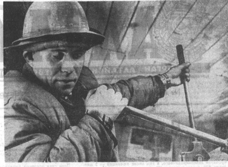
● Нелегко труд бурового мастера. Большого внимания требует сам станок. Чуть оплошавший агрегат может надолго выйти из строя. Во время смены через определенное время нужно извлекать вверх образцы пород. Это тоже требует большого мастерства. И направление бурения должно идти строго по плану.

Для живой, политической четкой и злободневной информации время всегда найдется. А найдется оно потому, что люди просят к ней интерес. Стало быть, качество выступлений информаторов, так же, как и система в организации политических бесед, является главным условием.