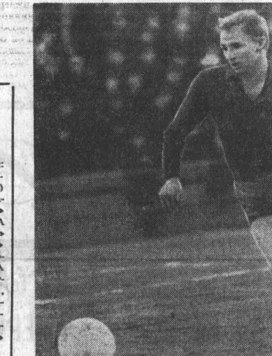
На снимке: момент игры.

С первых минут этого поединка пели соперники определились довольно ясно. Гости уступали ничья, и поэтому они откровенно избрали защитный вариант, оттянув в оборону пять человек.