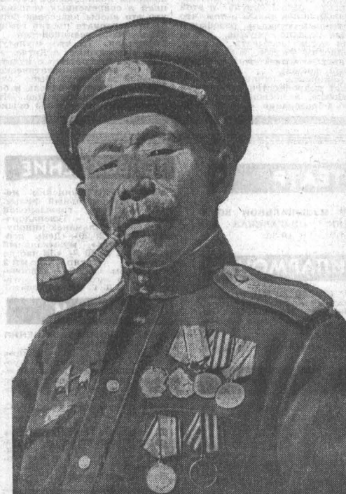
Ими гордится Забайкалье