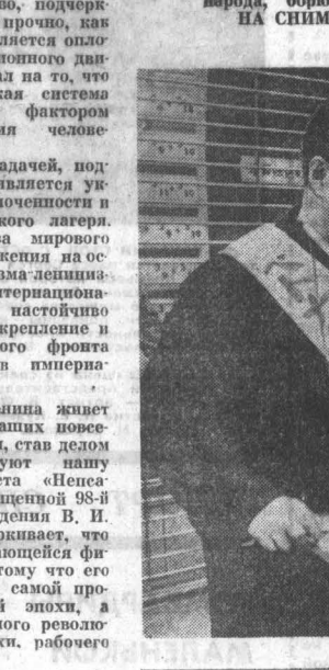
В Японии прошла кампания по сбору средств в фонд поддержки вьетнамского народа, борющегося против американской агрессии. НА СНИМКЕ: сбор средств на центральной улице Токио Гинзе.

ХАНОЙ, 21 апреля. (ТАСС). Зенитчики Вьетнамской народной армии сбили 18 апреля над провинцией Куангбинь один американский самолет, вторгшийся в воздушное пространство Демократической Республики Вьетнам. Как передает Вьетнамское