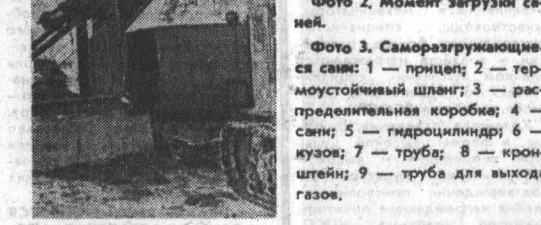
Гидравлическая система состоит из гидромотора от погрузчика-бульдозера ПБ-35 или РУ-06 и маслоподводящих трубок. Работает она от гидростанции трактора. Система обогрева проста. Горючий газ поступает в специальную трубу отбора, крепящуюся при помощи фланца к выхлопной трубе трактора, проходя через распределительную коробку в моечное пространство кузова и выходя через трубу (9). При разгрузке сани распределяется коробка разъединяется. Подогрев обеспечивает надежную работу сани в самых низких температурах.

Уборка навоза из животноводческих помещений и транспортировка его к месту хранения в совхозе «Комсомольский» организована следующим образом. Сдвинутой скотомойкой перемещается по желобу в железобетонный транспортер и подается в ковш-накопитель скипперного подъемника. В установленное время (утром и вечером) производится разгрузка. Для этого тракторист устанавливает сани под стрелой ковша (фото 2) и включает его привод. Предварительно поднимает клапанные ворота, тележка с ковшом доходит до упора, установленного в конце стрелы, останавливается, а ковш, освобожденный от зацепки, опускается вниз. При этом тележка фиксируется в верхнем положении специальным автоматом. После выгрузки включают обратный ход. Затем тракторист подает сани к следующему скипперу, и таким образом, за один рейс опорожняет три ковша, обслуживая 600 голов крупного рогатого скота. Навоз вывозится на расстояние до пяти километров и складируется в отдельные штабелями. Даже там, где применяется соломенная подстилка, эти машины работают надежно. Применение такой механизации позволяет сократить затраты труда на уборку, транспортировку, хранение и вывозе в почву тонны навоза до 3,5 часового-часа, а эксплуатационные издержки — до 2,4 рубля. В. ПИСМЕЛОВ — аспирант Алтайского политехнического института. В. ЛИСИ — инженер по эксплуатации машинно-тракторного парка совхоза «Комсомольский». М. ЕЛЕНК — старший инженер крайсовхозуправления.