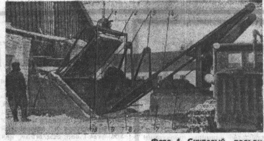
Сани сварной конструкции выполнены из швеллера № 44 и уголка. Полоз состоит из двух шнеков, расстояние между которыми 180 миллиметров. К ним приварены кронштейны (8), на них крепится труба (7), вокруг которой поворачивается кузов. В нижней части к ним приварены пальцы, в которых крепятся пальцы гидромотора. В передней части сани с пневматическим приводом жесткой сварной конструкции.