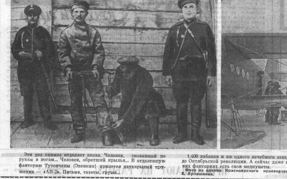
Эти два снимка отделяет эпоха. Человек, скованный по рукам и ногам... Человек, обретший крылья... В отдаленную факторию Тутовчан (Эвения) привезли двухкрылый труженник — «АН-2». Письма, газеты, грузы...