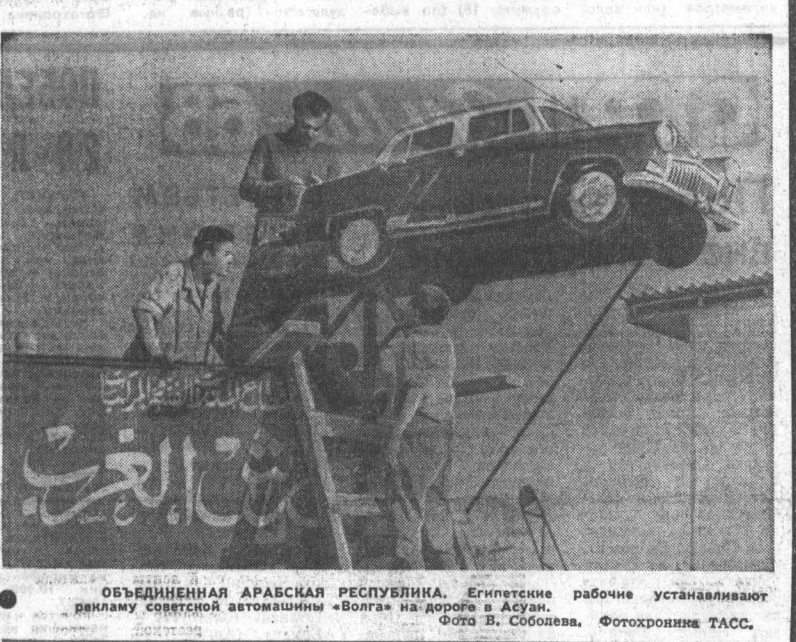
ОБЪЕДИНЕННАЯ АРАБСКАЯ РЕСПУБЛИКА. Египетские рабочие устанавливают панкиму советской автомашины «Волга» на дороге в Асуан.

ВЕЧНОЕ БРАТСТВО И НЕРУШИМАЯ ДРУЖБА МИТИНГ У ПАМЯТНИКА РУССКИМ ГРЕНАДЕРАМ — ГЕРОЯМ ПЛЕВНЫ Советские люди широко отмечают славную дату в жизни болгарского народа — 30-летие со дня освобождения Болгарии от оттоманского ига. 4 марта представители общественности Москвы пришли к памятнику русским гренадерам — героям Плевны, чтобы отдать дань глубокой любви и уважения мужественным воинам России — освободителям братского болгарского народа от многовекового ига. В числе почетных гостей — члены партийно-правительственной делегации Народной Республики Болгарии, прибывшие в Советский Союз на торжества по случаю знаменательной годовщины. Здесь же — кандидат в члены Политбюро ЦК КПСС, первый секретарь МК КПСС В. В. Гришин, председатель Центрального правления Общества советско-болгарской дружбы академик А. Н. Туполов, руководители государственных и общественных организаций. Начинается церемония возложения венка к подножию памятника. На их алых лентах — слова глубокой благодарности потомкам русских солдат, которые своей жизнью и кровью скрепили братскую дружбу двух народов. Звучат государственные гимны Народной Республики Болгарии и Советского Союза. Затем здесь состоялся митинг советско-болгарской дружбы. (ТАСС).