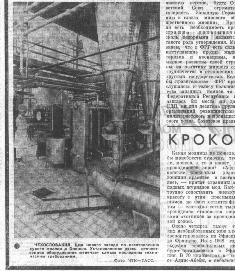
ЧЕХОСЛОВАКИЯ. Цех нового завода по изготовлению сухого молока в Опочне. Установленное здесь отечественное оборудование отвечает самым последним техническим требованиям.

щиванию вооружений Федеративной Республики, оснащение бюджета ядерным оружием и форсированию военных приотловлений. Неофашисты пытаются свести с нацистской Германией и переложить на другие государства ответственность за развязывание второй мировой войны, оправдать гитлеровских военных преступников, на совети которых миллионы загубленных человеческих жизней. Эти агрессивные, реваншистские требования можно разделить лишь как вызов народам Европы. Однако они не получают отпора со стороны правительства ФРГ. Такое развитие событий в Западной Германии не является случайным, это является следствием сложившейся во внешней и внутренней политике правящих кругов ФРГ, а именно способности и продолжат способствовать росту и активизации неонацизма. В немалой степени росту реваншистских и милитаристских тенденций в Западной Германии способствуют Соединенные Штаты Америки, опираясь на НАТО в качестве инструмента своей агрессивной политики, США делают ставку на повышение роли Западной Германии в этом блоке, за усиление западногерманского булдезвера. Приход к власти в ФРГ правительства с участием социал-демократов не внес по существу никаких изменений в ту политику покровительства и поощрения неонацистских и милитаристских сил, которая проводилась раньше. Тот факт, что правительство ФРГ намерено и дальше