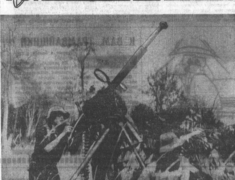
Южный Вьетнам. Зенитчиком Армии освобождения ведут огонь по американским самолетам.