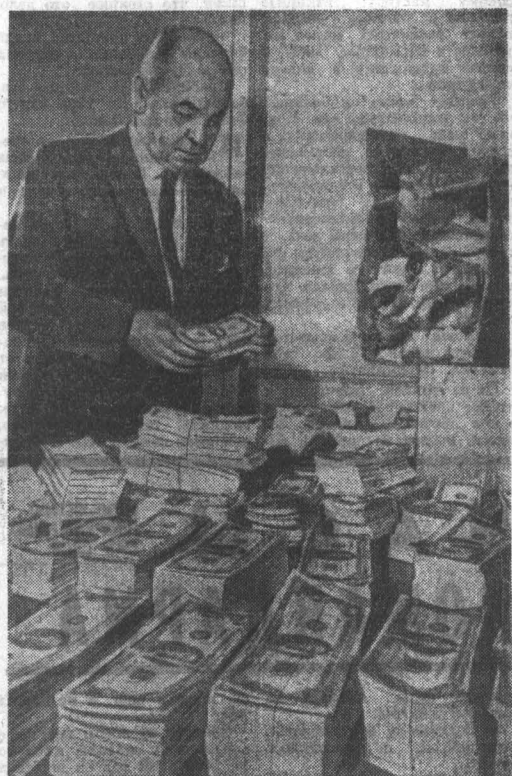
В США растет количество случаев подделки денег. На днях нью-йоркская полиция в багаже, перевозимом через аэропорт Кеннеди, обнаружила фальшивые доллары на сумму более 4 миллионов. Такой большой суммой контрабандной валюты до сих пор захватить не удалось.

М. ЛАПИЦКИЙ, М. БЕГЛОВ, А. БИРЮКОВ. (ТАСС).