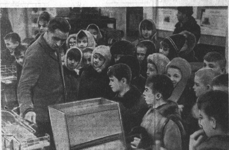
Первая в истории Бийска промышленная выставка вызвала большой интерес общественности. Ее уже посетили более шестидесяти тысяч человек. Здесь представлены экспонаты промышленных предприятий города. Выставка привлекает не только взрослых, ее охотно посещают и дети. Сюда часто приезжают школьники из окрестных сел. НА СНИМКЕ: в зале промышленной выставки.

детям есть чему поучиться у этого славного человека, умного руководителя, заботливого воспитателя. За все время в школе получили аттестаты зрелости 798 человек. Кем они стали? Ополо двухсот — учителями, больше сотни — сельскими врачами, 124 — специалистами сельского хозяйства и промышленности, четверо — научными работниками. В совхозе «Путь Ленина», в соседнем сов-