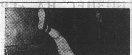
Более 150 спортсменов из девяти коллективов физкультуры участвовали в перенесенной в Барнауле классической борьбе.

Бутан — небольшое государство в Гималаях — славится в мире филателистами своими красочными, отличными техническими исполнением почтовыми марками. В нашей стране марки Бутана весьма редки. Продажа марок Бутана в Бутане один из основных источников поступления иностранной валюты. Поэтому правительство Бутана выпустило несколько серий марок, подобных которым коллекционеры еще не видели. Нигде в мире до сих пор не выпускались стереоскопические почтовые марки. Для изготовления их более четырех лет в обстановке крайней секретности разрабатывались специальные технологии. Были созданы особые фотоаппараты, методы контроля печатного процесса с помощью микроскопов, особое химическое покрытие, создающее иллюзию глубины. Эти многочисленные марки представляют собой парные изображения размером 4,5 сантиметра в ширину и 3,5 сантиметра в высоту. Каждая пара марок имеет одинаковую окраску и рисунок, но сдвинута относительно друг друга на определенное расстояние. Благодаря этому при просмотре марки через стереоскоп создается иллюзия трехмерного изображения.