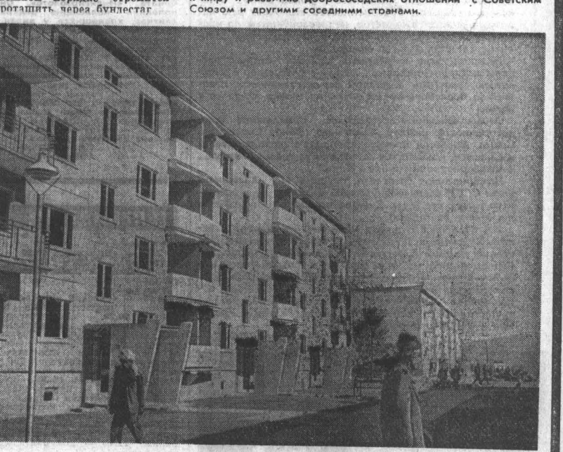
В столице Афганистана — Кабуле с помощью Советского Союза сооружаются два микрорайона. На фото: новые земельные дома.