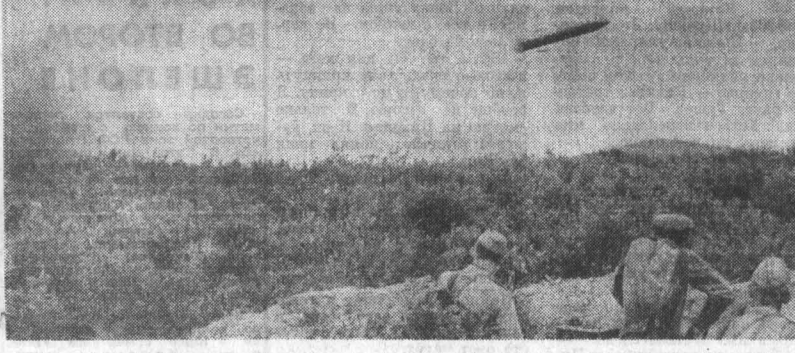
Ракетчики Краснознаменного Дальневосточного военного округа днем и ночью совершенствуют свое боевое мастерство. Веном тактических учений явились практические пуски ракет.

«Поведи нас Волга, — скажет лейтенант. — Пока жив хоть один батарея, фашисты не пройдут. Кончались у баскаковцев и гранаты, и бутылки с горю-