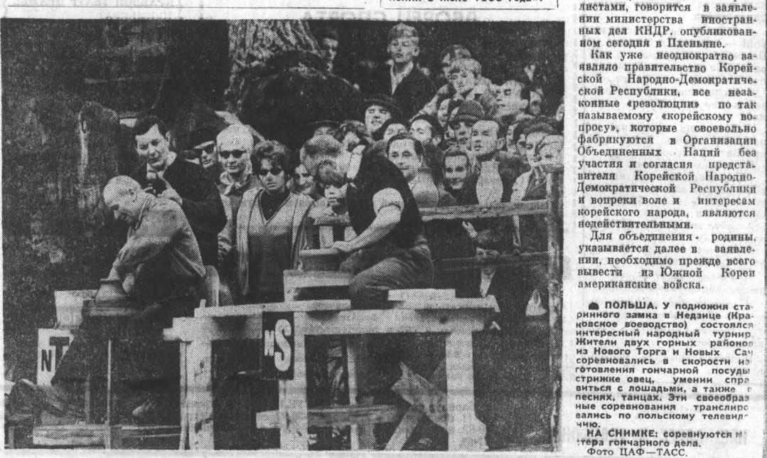
НА СНИМКЕ: соревнуются в играх гонимого дела.

НЬЮ-ЙОРК, 17 ноября. (ТАСС). В греческом городе Салоники готовится судебная расправа над 38 греческими крестьянами. Как сообщает агентство АР, их обвиняют в «подстрекательстве и мятежу в районе Салоники в июле 1966 года».