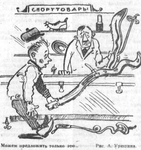
Можем предложить только это. Рис. А. Урюпина.

Опару готовят через каждые 3-5 дней. Чтобы ускорить процесс дробления и улучшить вкус кормов, добавляем патоку из расчета один килограмм на 100 килограммов зерна.