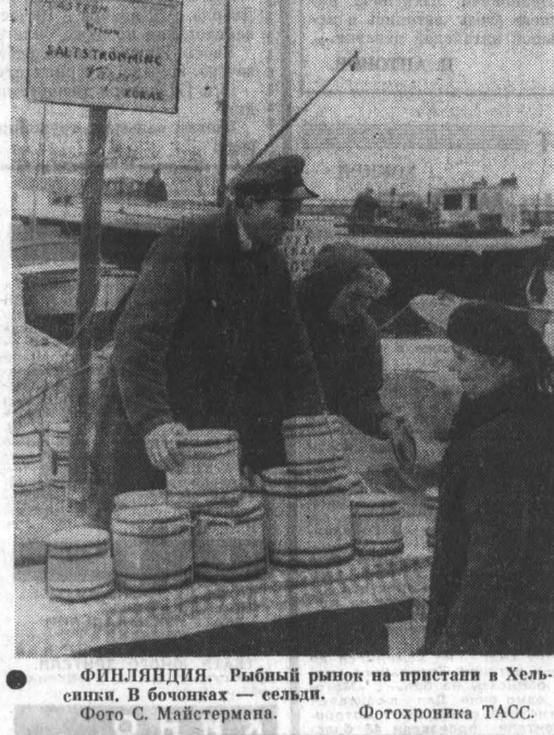
ФИНЛЯНДИЯ. Рыбный рынок на пристани в Хельсинки. В бочках — сельдь.

К середине ноября комитет зарегистрировал уже более 19,5 тысячи изобретений. Многие из них связаны в заключение В. Е. Череповцева, вызвали интерес у зарубежных фирм. Так, лицензия на технические новшества, улучшающие эксплуатацию доменных печей, приобрела японская фирма «Фуджи Сейтэн». А западногерманская фирма «Леонард Герберт» приобрела лицензию на старую для сборки покрышек пневматических шин.