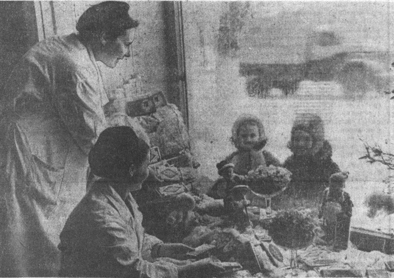
Доможица. Фото А. Калабухова. (Красная-фотоэкспозиция «Алтай социалистический».)

Сны безмятежные недосмотрешей. Пели солдатки протяжно и нежно О недолюбленных, недолюбивших. Шла эта песня по улице снежной. Словно солдат на побывку прибиравший. Пели солдатки. О, как они несли! Так, что село обходили метели. Так, что (скажу вам без фальши и лести) Быть мне хотелось пропавшим без вести. ... Она играла очень хорошо, Она играла, может, гениально. А за окном осенний дождик шел, И все казалось чужою печальным: И музыка, и осень, и она. И пальцы, что легко касались клавиш. И к сердцу подступала, как волна, Святая грусть, которой не слухавши.