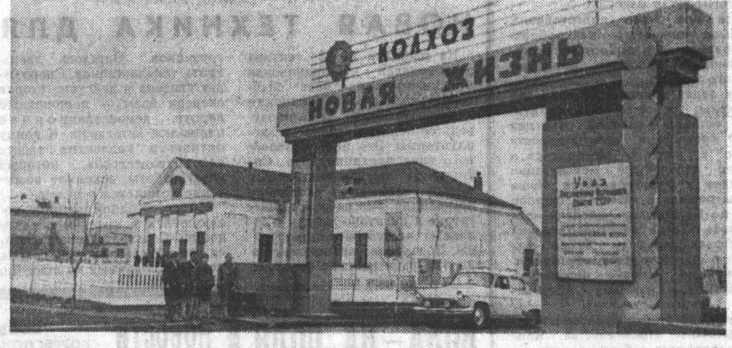
● Ордена Ленина колхоз «Новая жизнь» Челябинского района Тульской области награжден Памятным знаком ЦК КПСС, Президиума Верховного Совета СССР, Совета Министров СССР и ВЦСПС. Во Всесоюзном смотре-конкурсе на лучшую застройку и благоустройство колхозных и совхозных поселков, который проводится в ознаменование 50-летия Великого Октября и 100-летия со дня рождения В. И. Ленина, его центральной усадьбе присужден диплом первой степени. На снимке: въезд на центральную усадьбу колхоза «Новая жизнь».