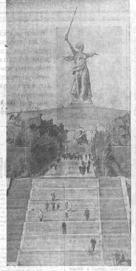
ВОЛГОГРАД. МАМАЕВ КУРГАН. ОБЩИЙ ВИД ПЯТИМЕТРИИ-АНСАМБЛЯ ГЕРОИМ БИТВЫ НА ВОЛГЕ.

ЦК КПСС, Президиум Верховного Совета СССР, Совет Министров СССР и ВЦСПС приняли постановление о награждении республик, краев и областей за заслуги в развитии социалистической экономики и культуры памятными знаменами ЦК КПСС, Президиума Верховного Совета СССР, Совета Министров СССР и ВЦСПС в честь 50-летия Великой Октябрьской социалистической революции.