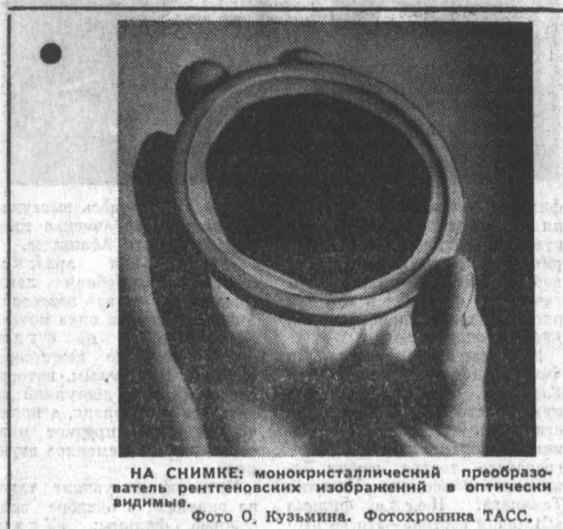
НА СНИМКЕ: монокристаллический преобразователь рентгеновских изображений в оптически видимые.