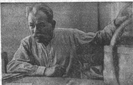
В РЕДАКЦИЮ ГАЗЕТЫ «АЛТАЙСКАЯ ПРАВДА»