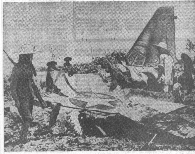
ДЕМОКРАТИЧЕСКАЯ РЕСПУБЛИКА ВЬЕТНАМ. Обломки американского самолета, сбитого защитниками Ханоя.

КАИР, 5 сентября. Представитель командования израильской армии заявил, что сегодня утром израильские войска неоднократно открывали огонь по позициям египтян. Израильские войска открыли огонь по позициям египтян, в результате перестрелки два израильских солдата легко ранены. Несомненно, подчеркнул он, противник понес значительные потери от огня израильских войск.