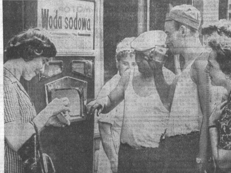
ПОЛЬСКАЯ НАРОДНАЯ РЕСПУБЛИКА. Союз потребителей «СПОЛЭМ» закупил в СССР партию автоматов по продаже газированной воды.

На северо-востоке страны в городе Аньшань (провинция Ляонин) продолжают серьезные столкновения. Сообщают, что в этом районе разрушено несколько домовных печей, производство частично остановлено.