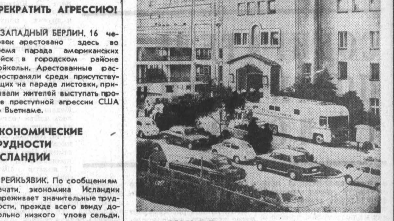
СФОРУ. В Белграде начала работу новая телестудия. Она оснащена самым современным оборудованием. НА СНИМКЕ: здание телестудии в Белграде.

ЛАГОС. Положение в Нигерии остается напряженным. На всех фронтах продолжают военные действия между войсками федерального правительства и частями восточнонигерийских вооруженных сил. Как сообщили в хорошо информированных кругах, отряды федеральных войск, продвигаясь с севера к столице Средне-Западного штата городу Бенину, почти не встречают сколько-нибудь серьезного сопротивления.