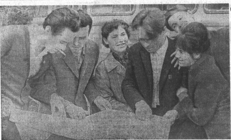
В прошедший четверг барнаульцы тепло проводили своих посланцев — участников агитбригады предприятия краевого центра для обслуживания хлеборобов в период уборочной страды. По традиции перед отъездом в районы агитбригады собрались на площади Свободы. Здесь состоялся короткий митинг. Лучшие коллективы котельного и моторного заводов, «Трансмаш», комбината химических волокон, ТЭЦ-2 и других возут свои концерты на поля Алтая. НА СНИМКЕ: участники агитбригады моторного завода на площади Свободы.