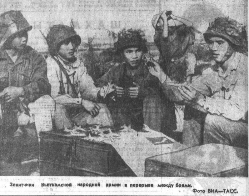
Зенитчики Вьетнамской народной армии в перерыве между боями.