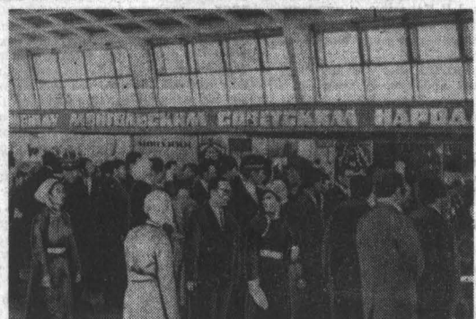
УЛАН-БАТОР. В Центральной выставочной зале открылся монгольская и советская фотовыставка, посвященные 20-й годовщине со дня организации Общества монголо-советской дружбы.

С приветственным словом к участникам конференции обратился заведующий отделом сельского хозяйства Красноярского крайкома КПСС В. С. Селезнев.