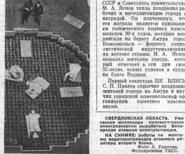
СВЕРДЛОВСКАЯ ОБЛАСТЬ. Уже свыше миллиарда киловатт-часов электроэнергии вырабатывает Белоярская атомная электростанция. На снимке: работы по монтажу водопаропровода атомного реактора второго блока. Фото А. Грехова. Фотокроника ТАСС.

КОМСОМОЛЬСК-на-Амуре 17 июня. (ТАСС). Орден Ленина — на знамени города юности. Эту награду на торжественном собрании вручил сегодня член ЦК КПСС, Председатель Президиума Верховного Совета РСФСР М. А. Яснов. По поручению ЦК КПСС, Президиума Верховного Совета СССР и Советского правительства М. А. Яснов тепло поздравил рабочих и интеллигенцию города с наградой. Он подчеркнул, что эта награда является признанием героического подвига комсомольцев 30-х годов, которые воздвигли на берегу Амура город Комсомольск — форпост социалистической индустриализации на востоке страны. М. А. Яснов поздравил жителей города, который отмечает в эти дни свое 35-летие, новых успехов в труде на благо Родины. Первый секретарь ЦК ВЛКСМ С. П. Павлов сердечно поздравил жителей города на Амуре и вручил городской комсомольской организации памятное красное знамя. Фото А. Грехова. Фотокроника ТАСС.