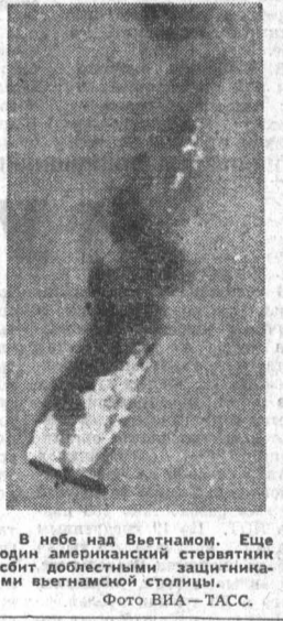
В небе над Вьетнамом. Еще один американский стертник сбит доблестными защитниками вьетнамской столицы.

НЬЮ-Йорк, 19 июня. (ТАСС). Председатель Совета Министров СССР А. Н. Косыгин имел вчера дружескую беседу с Председателем Совета Министров Польской Народной Республики Ю. Циряквичем. В беседе принял участие министр иностранных дел ПНР А. Рапацкий. В тот же день А. Н. Косыгин имел дружескую беседу с председателем правительства Чехословацкой Социалистической Республики И. Ленартом, в которой принял участие министр иностранных дел ЧССР В. Давид и постоянный представитель ЧССР при ООН М. Клузак. Беседы касались положения на Ближнем Востоке, сложившегося в результате израильской агрессии, и связанной в связи с этим чрезвычайной специальной сессии Генеральной Ассамблеи ООН. В беседе принял участие с советской стороны министр иностранных дел СССР А. А. Громыко. НЬЮ-Йорк, 19 июня. (ТАСС). Председатель Совета Министров СССР А. Н. Косыгин имел вчера встречу с главой государства Сирийской Арабской Республики Н. Аташи. В дружественной обстановке состоялся обмен мнениями относительно положения на Ближнем Востоке и по вопросам, касающимся чрезвычайной специальной сессии Генеральной Ассамблеи ООН. В беседе принял участие с советской стороны министр иностранных дел СССР А. А. Громыко, постоянный представитель СССР при ООН Н. Т. Федоренко; с сирийской стороны — постоянный представитель Сирии при ООН Жюль Томе.