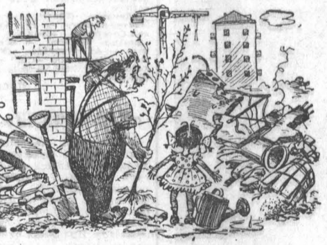
Рис. А. Урюпина.

Оставил-таки жителей райцентра без газет и журналов. Так, благодаря усилиям райисполкома, нужное, важное дело помощи сию принял уродину форму.