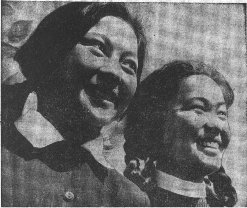
У этих учени Горно-Алтайской национальной школы чудесное настроение. Окончили занятия. Впереди каникулы — время отдыха, веселых игр, туристских походов, пионерских кустов.

Гастроли этого года особенные. Все ближе и ближе великая дата — 50-летие Советской власти.