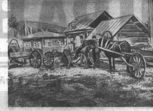
Так выглядел Горно-Алтайск до революции.