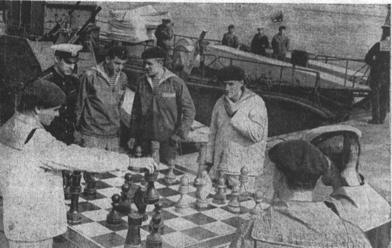
Тихоокеанский пограничный округ. Сегодня страна празднует День пограничника — воина в зеленых фуражках, охраняющих рубежи Родины. Эти снимки сделаны на дальневосточной границе СССР...