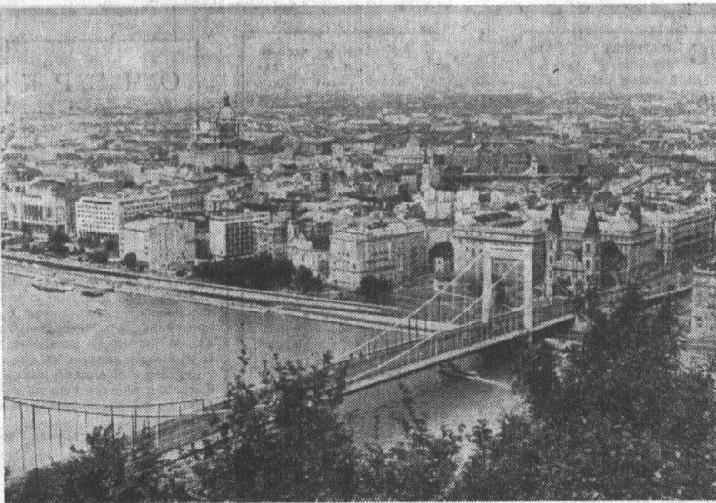
Весенний Будапешт — столица народной Венгрии. Вид на город и мост «Фрежет» через Дунай.

ХАНОЙ. Южновьетнамские патриоты продолжают наносить удары по американским агрессорам и их марionеткам. Только за последние четыре дня, сообщает агентство ВНА, патриоты сбросили четыре американских вертолета и один самолет-истребитель «F-105».