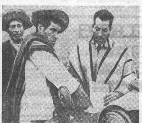
Жалкое существование влчат коренные жители американского материка — индейцы. Почти все они живут в горных районах и лишь изредка спускаются в города и поселки, чтобы на рынок продать несмысленные свои изделия и получить немного денег. До индейцев Колумбия, Эквадора, Перу, Боливии не дошли ни цивилизация, ни культура. Почти все они неграмотны, и из-за этого не могут получить работы на промышленных предприятиях. Когда же индейцы удаются найти какую-нибудь работу, то он срывается контракт вот таким, издавна применяемым способом (на снимке).

Этот законопроект предусматривает также штраф в сумме до 10.000 долларов и пятилетнее тюремное заключение за «препятствие» чинимое персоналом военного персонала или поставкам вооружения в период вооруженного конфликта».