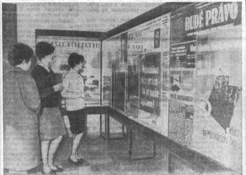
ПРАГА. В столице Чехословакии в здании Музея В. И. Ленина открылась выставка «Ленин и чехословацкое рабочее движение». Здесь собраны оригинальные документы и фотографии, рассказывающие о его пребывании в Праге, о его связи с чехословацкими рабочими и коммунистическим движением. Выставка охватывает период с 1900 г. до наших дней торжества идей ленинизма в ЧССР. На снимке: посетители осматривают экспонаты выставки.

По мнению сенатора Фулбрайта, приезд генерала, его публичные выступления и встречи с конгрессменами — это заключительный этап в кампании, ставящей целью добиться согласия на значительное увеличение численности американских войск во Вьетнаме.