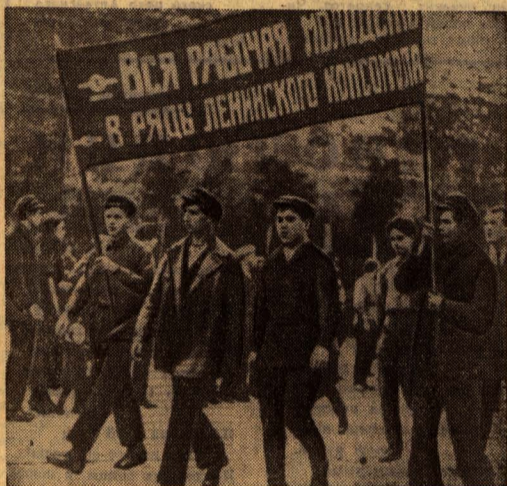
● Первые комсомольцы Алтая. [Снимок 20-х годов].

● Наступление фашистов на Москву остановлено, Советская Армия перешла в контрнastупление. Пехотные части вступают в освобожденный город Южно-Калужской области. Декабрь 1941 г.