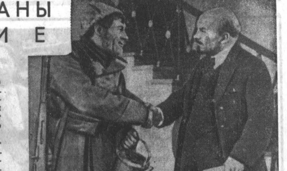
НА СНИМКЕ: кадр из фильма «Человек с ружьем».

На экране воссоздаются эпизоды из фильмов «Ленин в Польше», «Человек с ружьем», «Лев Свердлов», «Рассказы