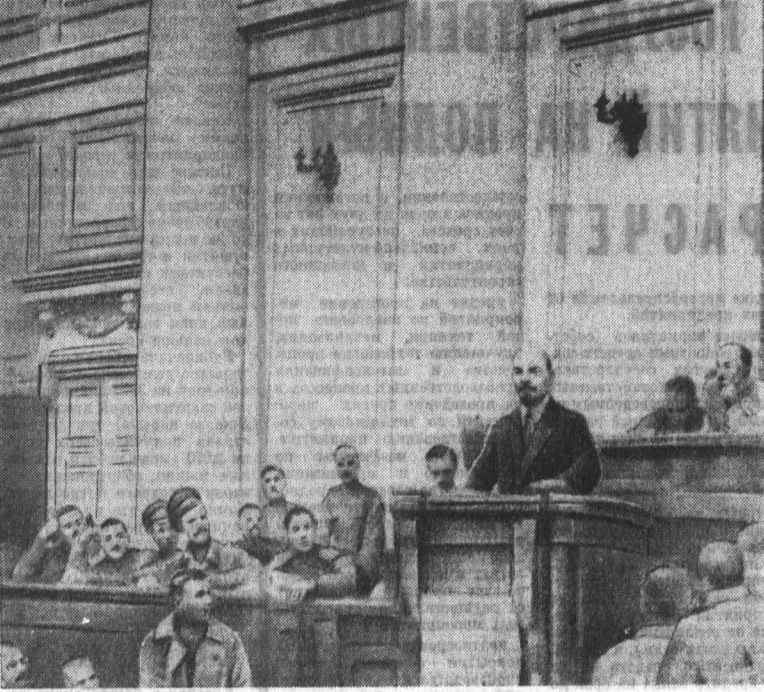
В. И. Ленин выступает в Таврическом дворце с Апрельскими тезисами. Петербург, 4 (17) апреля 1917 года.

АПРЕЛЬСКИЕ тезисы В. И. Ленина дали партии и пролетариату гениальный план борьбы за переход от буржуазно-демократической революции к революции социалистической. Тезисы — один из наиболее выдающихся документов творческого марксизма. В них воплощена необычайная смелость и глубина ленинских идей, сыгравших решающую роль в дальнейшем развитии революции.