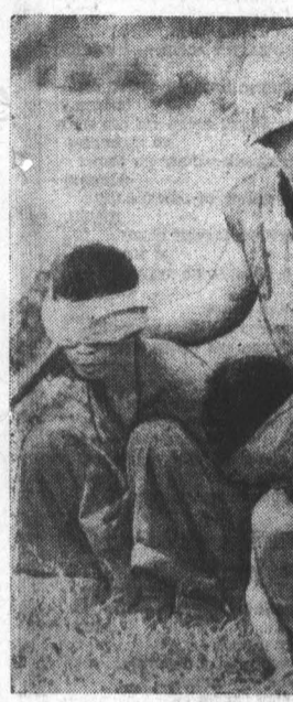
Этот снимок сделан корреспондентом американского агентства Ассошиэтед-Пресс в Южном Вьетнаме, южнее демилитаризованной зоны. Солдат морской пехоты США ведет двух «подозрительных» вьетнамцев. Конвоир, позу, улыбаются. Легко воевать с безоружными...

Политбюро ФКП критикует политику правительства, которая способствует увеличению прибыли и вызывает непропорциональные расходы. Вступление Франции в общий рынок, указывается в заявлении, не помогло разрешить стоящие перед страной экономические и социальные проблемы.