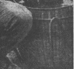
ЮЖНЫЙ ВЬЕТНАМ. Мать увела из подполка и карателям, а плачущего ребенка сунули в корзину, видимо, чтобы не убежал и партизанами. По просьбе фотожурналиста американский солдат развлекается с несчастным мальчиком.

ПУНТА-ДЕЛЬ-ЭСТЕ. Представители латиноамериканских стран согласились создать в течение 1970—1985 гг. латиноамериканский общий рынок. Министры иностранных дел американских государств достигли этой договоренности во время совместных заседаний, посвященных разработке общеполитической декларации и окончательной подготовке повестки дня совместных заседаний президентов стран Америки.